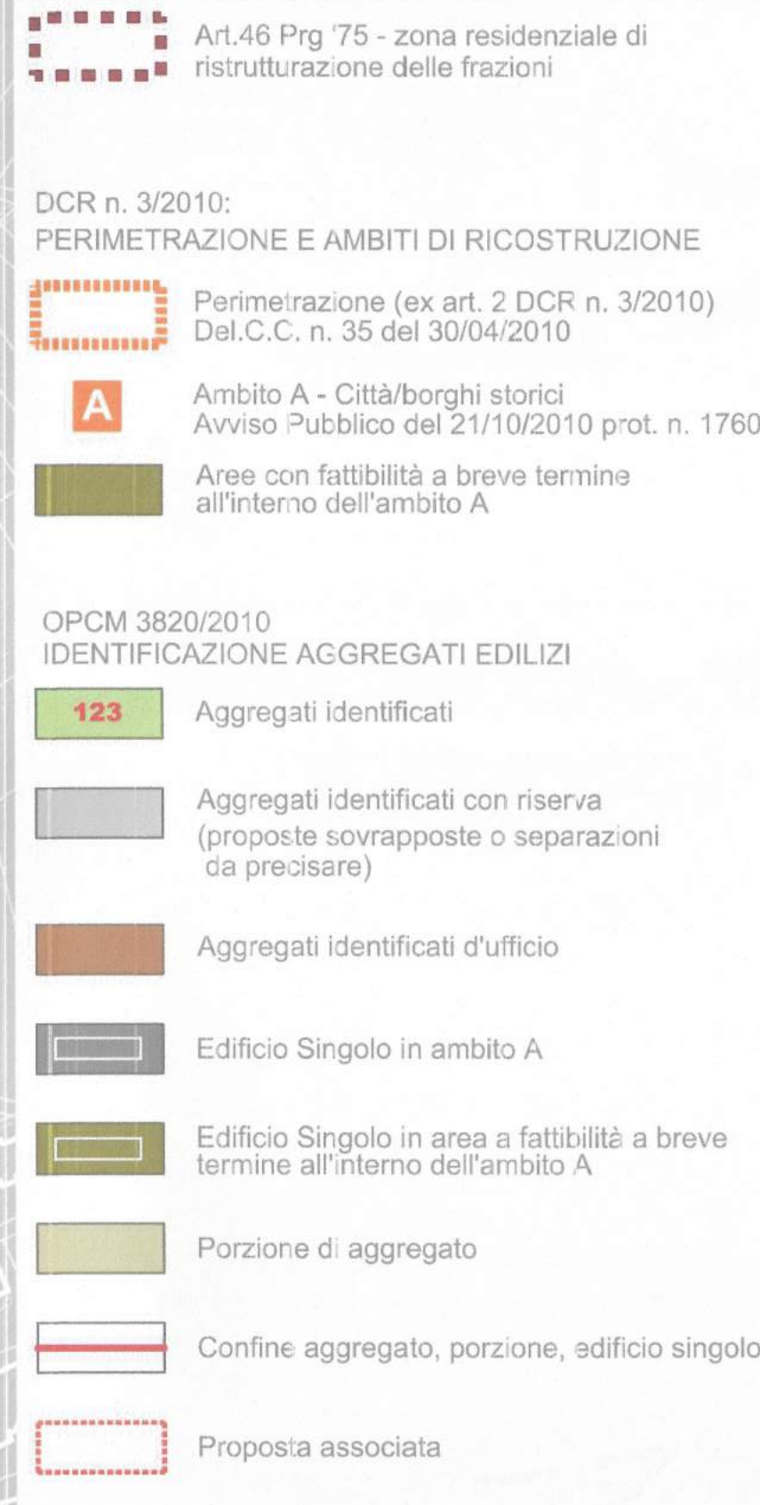
AMBITI DI INTERVENTO - PERIMETRAZIONE E AMBITI DI RICOSTRUZIONE - FRAZIONE TEMPERA Planimetria estratta da " Allegato Disp. Prot. 97446 del 29.10.2015"