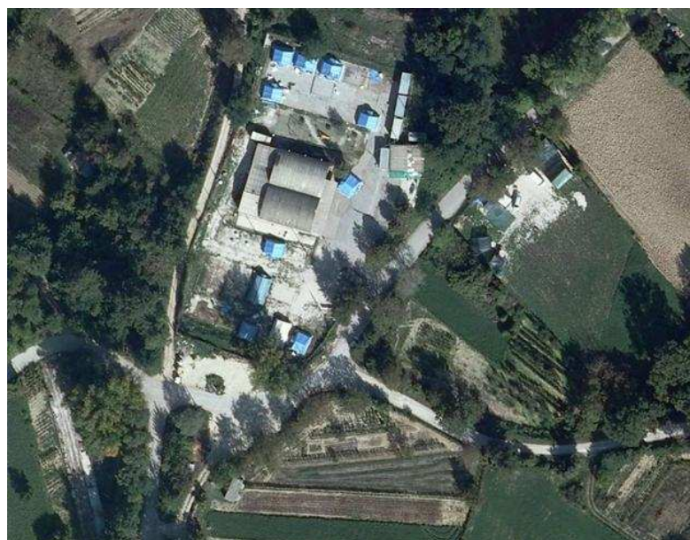
Vista aerea dell'area