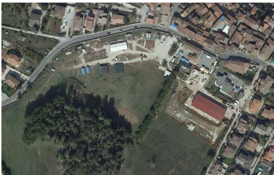
Vista aerea dell'area