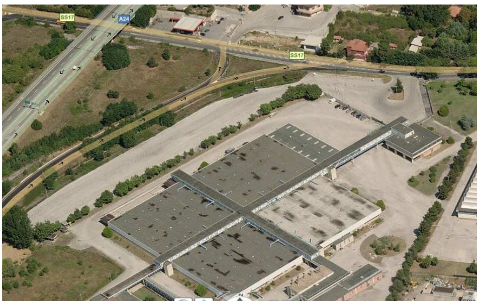
Vista aerea dell'area