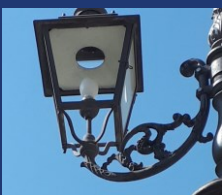
sodio alta pressione 2.700K CRI 45